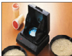
• Analizador de Arroz TX200

Kett se mantiene detrás de los sistemas TR130 con una Garantía de fabricación de un Año completo en Cuidados de piezas , mano de obra y cumplimiento de las especificaciones. La solvencia y confiabilidad Kett le permite enfocarse productivamente en el mejoramiento de la calidad de sus productos sin perder tiempo calibrando y verificando nuestras mediciones. Kett es reconocida a nivel mundial como el líder mundial en instrumentos de medición de granos. Con más de 65 años de diseños y fabricación de excelencia, el TR130, como todos los instrumentos Kett, es el estándar en el cual los otros son juzgados.