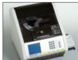
• Clasificadora de Arroz Automatizado RN600