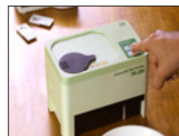
• Descascaradora Eléctrica de Arroz Avanzada TR250