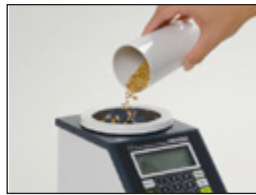
• Medidor de Humedad Avanzado PM650