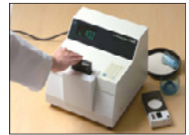
• Medidor de Blancura de Arroz C600